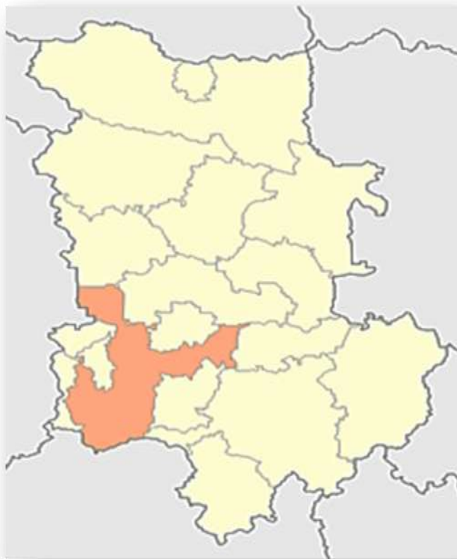
Фиг.1- Разположение на община Родопи в територията на област Пловдив

Община Родопи се намира в Южна България югозападно от град Пловдив и административно принадлежи към едноименната област – пловдивска област. Разположена е в онази част на Горнотракийската низина, която граничи на север с община Съединение и е в близост до подножието на Средна гора, а на юг с подножието на северните склонове планина Родопи.