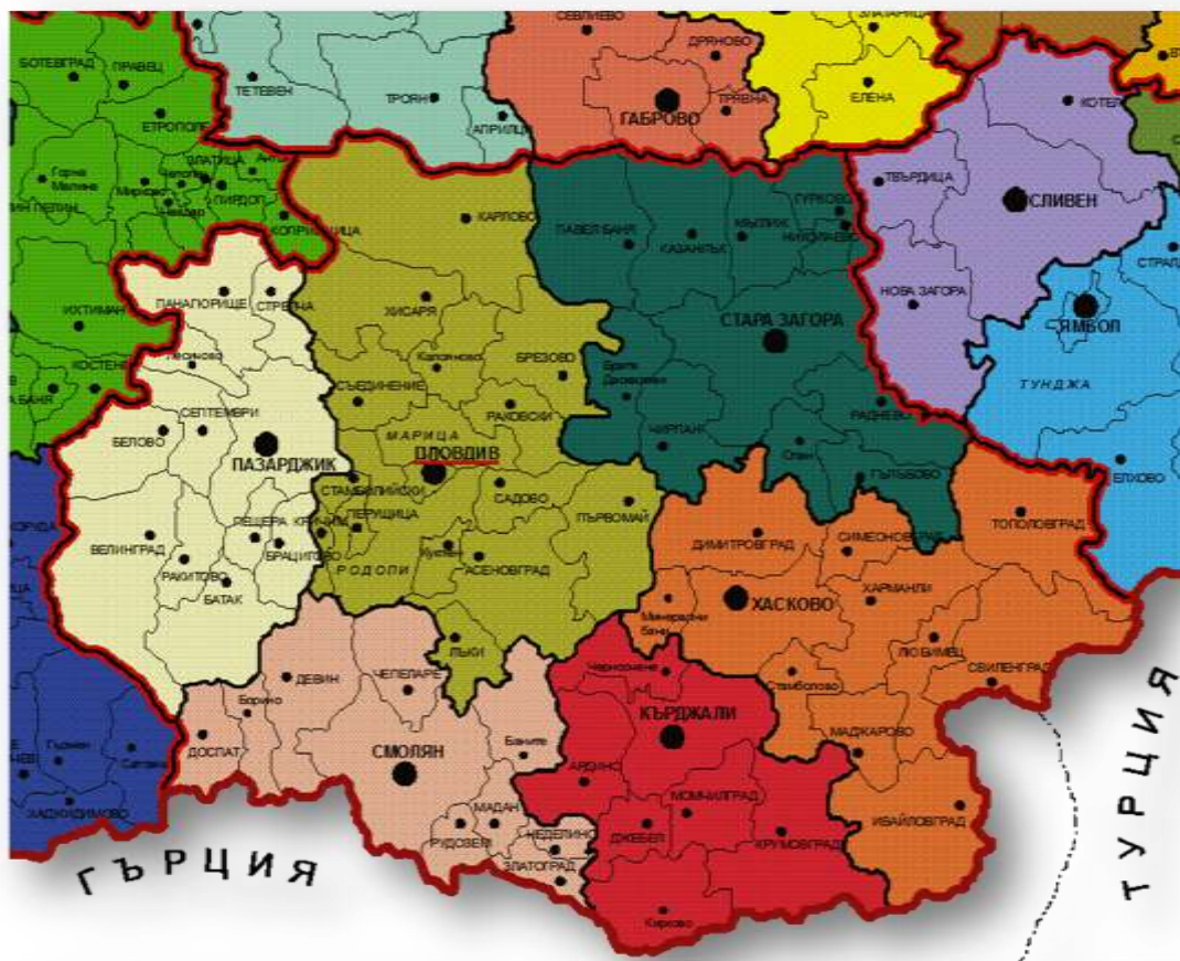
Фиг.3- Разположение на областите и общините в Южен централен район за планиране

Община „Родопи“ има територия от 524 кв.км и заема около 10% от площта на Пловдивска област и 1.9% от територията на ЮЦР. От следващата фиг.3 ясно се виждат както разположението на община Родопи в Южния централен район за планиране, така и разположението на областите и общините в него.